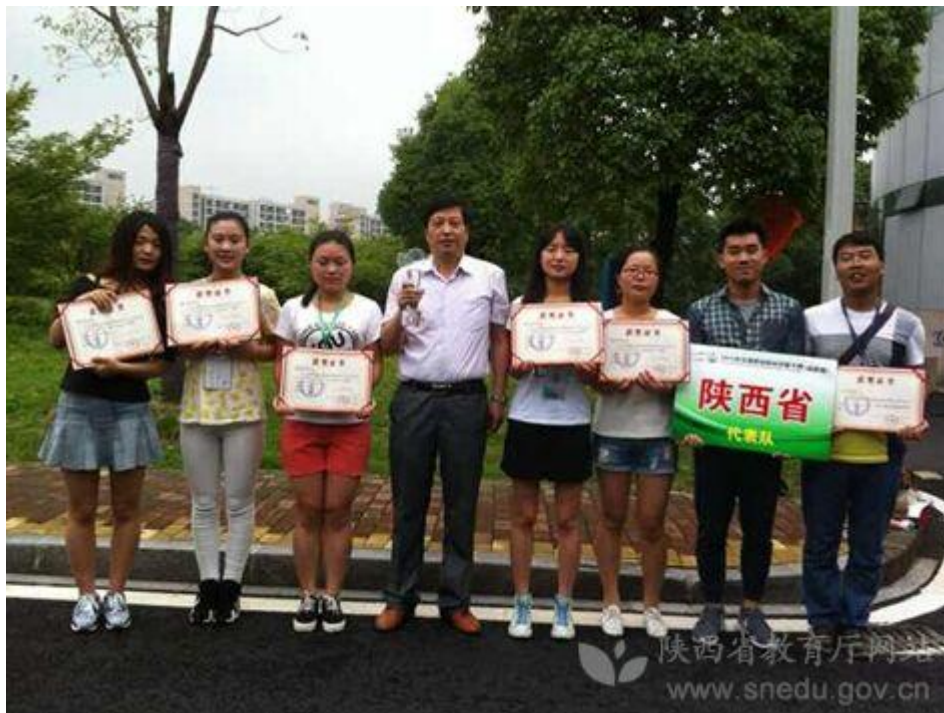
我院代表陕西省参加全国职业院校技能大赛农产品质量安全检测赛并获奖